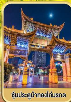
ซุ้มประตูม้าทองไถ่มรดก