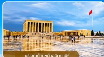
บริเวณด้านหน้าอนีกาบิร์

สถานที่สำคัญที่คนตุรกีให้ความเคารพและจดจำผู้นำผู้ยิ่งใหญ่ ที่อุทิศทั้งชีวิตเพื่อชาติ ศาสนา และประชาชน