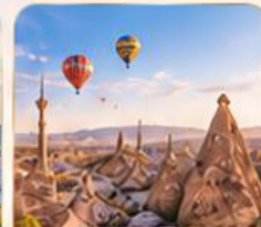
CAPPADOCIA คัปปาโดเกีย