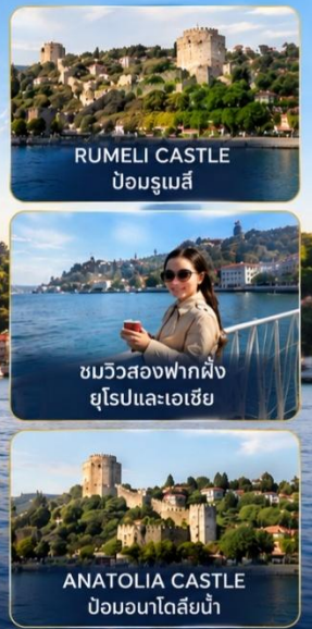
RUMELI CASTLE ป้อมรูเมลี

สัมผัสเสน่ห์อันงดงามของอิสตันบูลจากผืนน้ำ