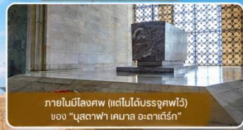
ภายในมีโลงศพ (แต่ไม่ได้รับอนุญาตให้เข้า) ของ "มุสตาฟา เคมาล อะตาเติร์ก"