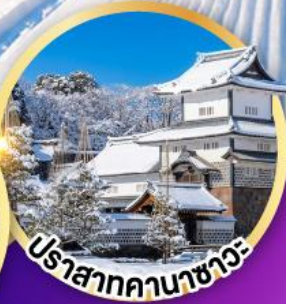
ปราสาทคานาซาวะ

ล่องเรือสำราญโซกาวะ ชมบรรยากาศหิมะและธรรมชาติ สวนเคนโระคุเอ็น 1 ใน 3 สวนที่งดงามที่สุดของญี่ปุ่น