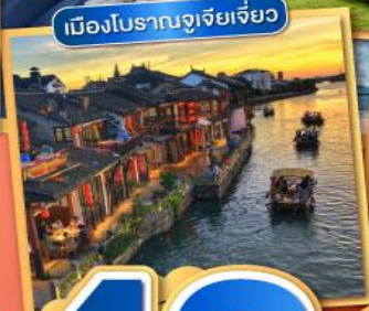
เมืองโบราณซูเจียวเจียว