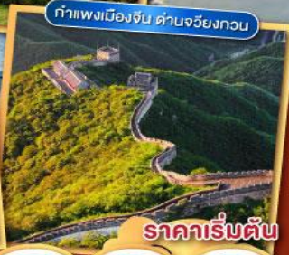
กำแพงเมืองจีน ด่านจวิ๋นกวอน