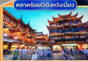
ตลาดร้อยปี ding hui miao