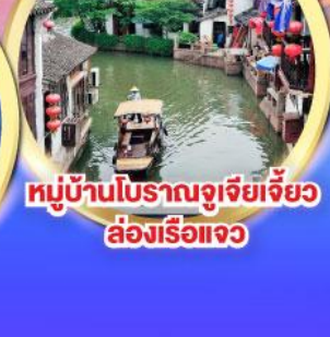
หมู่บ้านโบราณจูเจียเจี้ยว ล่องเรือแจว