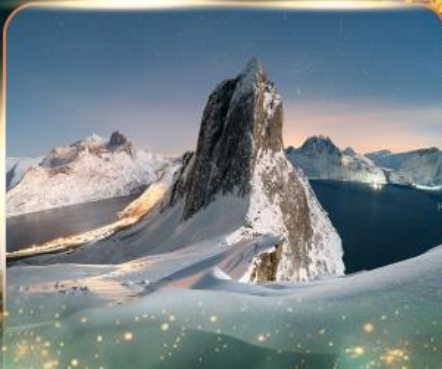
เกาะเซนญา