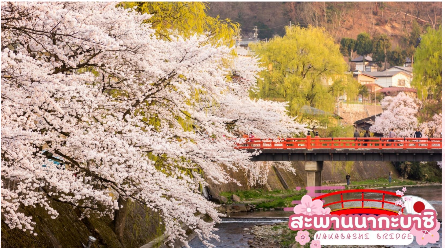
สะพานนากะบาชิ NAKABASHI BRIDGE

สะพานนากะบาชิ (Nakabashi Bridge) สะพานสีแดงของย่านเมืองเก่า สะพานทอดข้ามแม่น้ำมิกากา วะที่ไหลผ่านใจกลางเมือง สะพานแห่งนี้ถือเป็นสัญลักษณ์ของเมืองทาคายามา (ซากุระขึ้นอยู่กับ สภาพอากาศ)