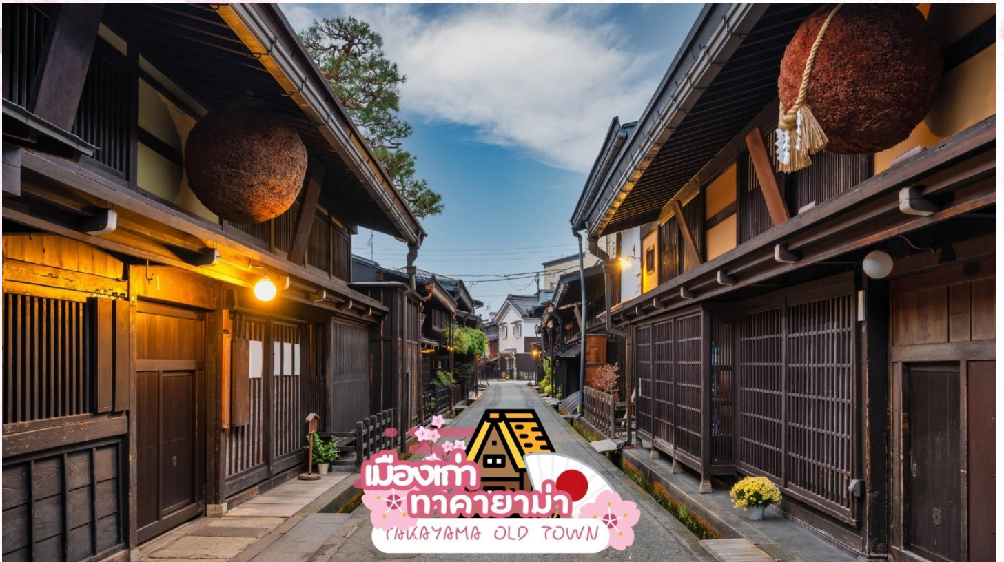
เมืองเก่า ทาคายามา TAKAYAMA OLD TOWN

สะพานนากะบาชิ (Nakabashi Bridge) สะพานสีแดงของย่านเมืองเก่า สะพานทอดข้ามแม่น้ำมิกากา วะที่ไหลผ่านใจกลางเมือง สะพานแห่งนี้ถือเป็นสัญลักษณ์ของเมืองทาคายามา (ซากุระขึ้นอยู่กับ สภาพอากาศ)