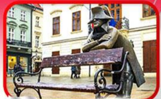
ย่านเมืองเก่าปราทิสลาวา

เที่ยวเมืองสวยริมทะเลสาบ ฮัลล์สตัดท์ • ชมเมืองไข่มุกแห่งโบฮีเมีย เซสกี กรุงลอน • ปราก • เวียนนา • ซอปปิงพาร์นดอร์ฟ เอาก์เล็ท